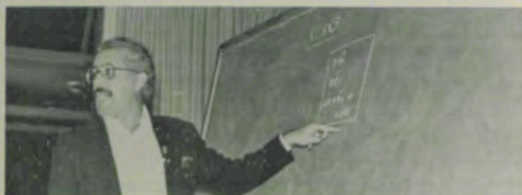
O professor Silviano Santiago.

A II Semana de Letras, promovida pela Universidade Federal de Viçosa, por meio do Conselho de Extensão e do Departamento de Letras e Artes, foi iniciada no último dia 15, no auditório do Departamento de Engenharia Florestal (DEF), com a palestra do professor Silviano Santiago, da PUC do Rio de Janeiro, sobre «Carlos Drummond de Andrade: o poeta enquanto intelectual».