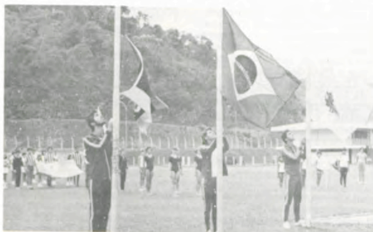
O hasteamento das bandeiras.