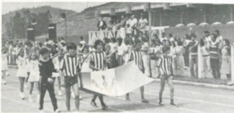
A equipe da Escola Estadual Dr. Raimundo Alves Torres, vencedora do desfile de abertura dos JEV 80.