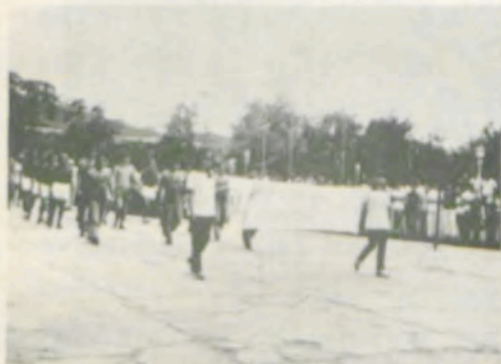
A equipe do Carcará, que representa as segundas séries das diversas Escolas da Universidade Rural.