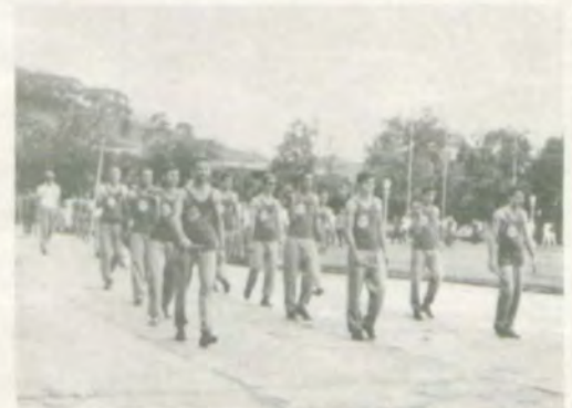
A equipe de atletismo da LUVÉ (Liga Universitária Viçossense de Esportes).