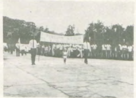
A equipe do Pingüim, quartanistas da Universidade Rural.

Tôdas as solenidades da abertura das "V. as OLIMPIADAS INTERNAS" contaram com a participação da Banda de Música da UREMG, que abrilhantou os festejos.