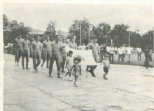
Representação dos pós-graduados da Universidade Rural.