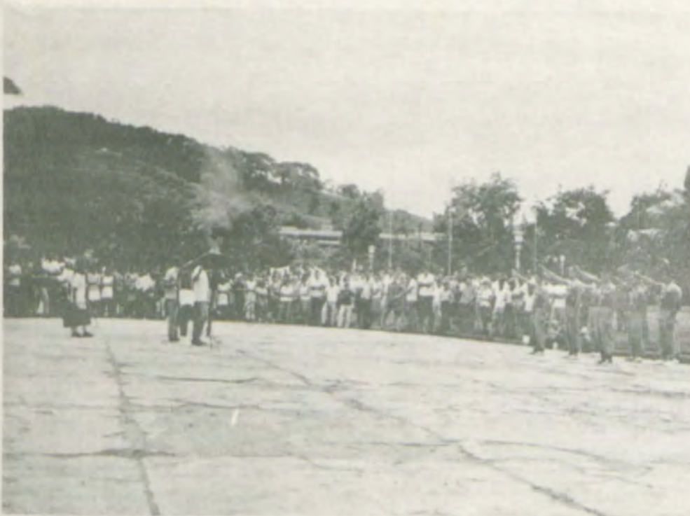
Flagrante do Solene Juramento do Atleta, na abertura das "V. as OLIMPIADAS INTERNAS DA UREMG".