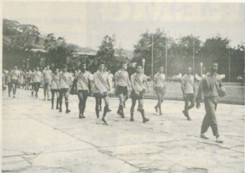
A equipe da LUVE (liga Universitária Viçosense de Esportes), desfilando defronte do prédio da ESA.