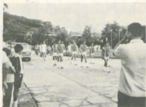
A equipe de basquete da LUVE.