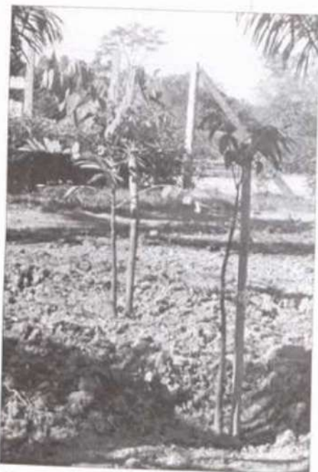
Comparação entre uma muda de mogno brasileiro (ao fundo) e outra enxertada em mogno africano