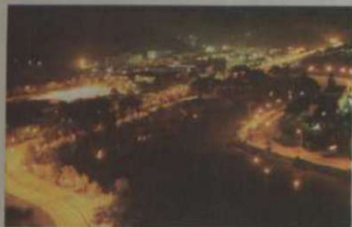
O Campus iluminado - Foto: Angelo Cardoso Teixeira