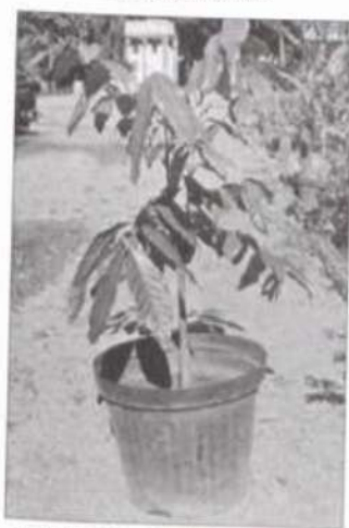
Muda de mogno brasileiro enxertada no caule de um mogno africano