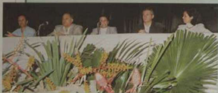
Mesa diretora da cerimônia de abertura da Semana

Com grande participação da comunidade, realizou-se na UFV, de 27 a 29 de setembro, a 1ª Semana de Orquídeas e Bromélias. Na ocasião aconteceram, no Centro de Vivência, várias palestras e debates, que contaram com cerca de 80 inscritos. Dentre outros assuntos, foram discutidos: Cultivo de orquídeas e bromélias; Educação ambiental e pre-