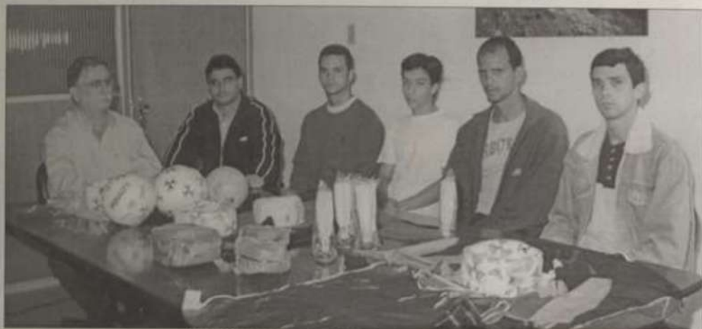
Momento da entrega do material aos representantes da Luve

A Associação Atlética Acadêmica Luve recebeu, no dia 28 de setembro, diversos materiais esportivos adquiridos pela UFV com recursos da União. São camisetetas, calções e meias para futebol e jogos de quadra, além de peças e bolas (futebol, futebol de salão, basquetebol, handebol e de vôlei), tendo sido investidos cerca de R$ 6 mil.