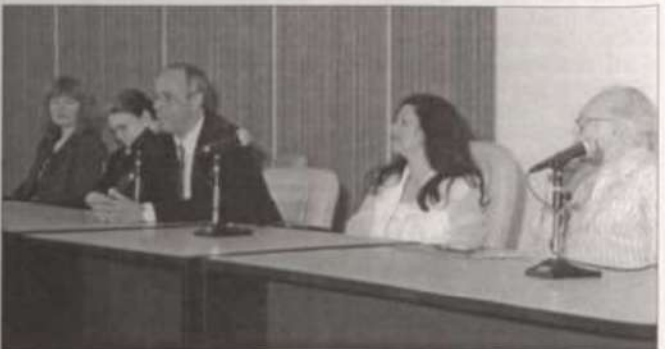
Personalidades presentes à cerimônia de abertura

O Encontro contou com o apoio da UFV e de diversas instituições e entidades públicas e particulares ligadas ao meio literário.