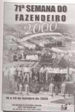
Fac-símile do cartaz

A Rádio Inconfidência volta a transmitir neste ano, diretamente da UFV, o programa mais tradicional da emissora, a "Hora do Fa-