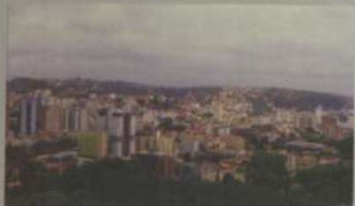
A cidade de Viçosa