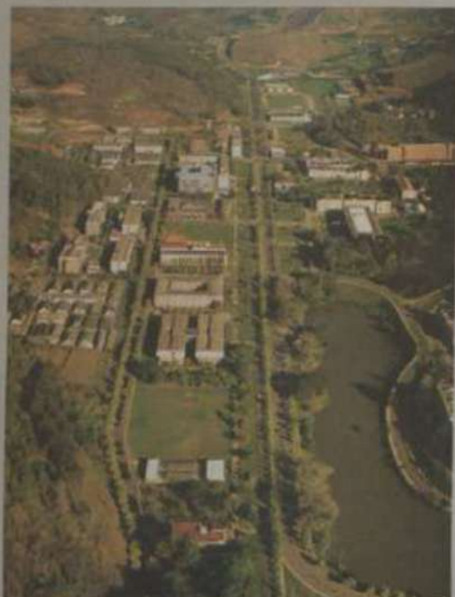
Parte central do Campus da UFV