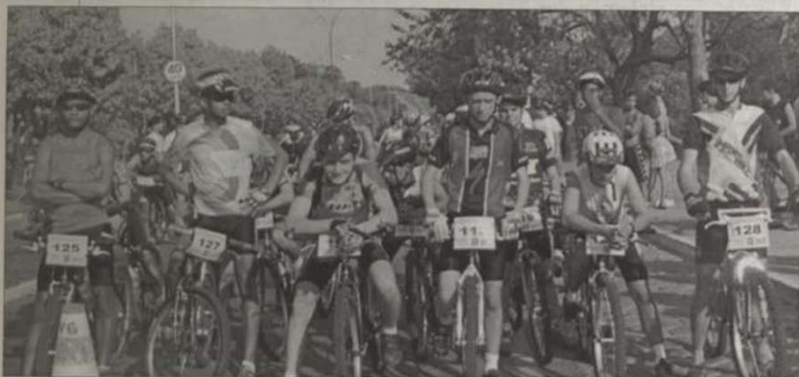
Participantes de uma das provas

Realizou-se no dia 24 de setembro, no campus universitário, a III Prova Ciclística da UFV, disputada por 112 atletas, distribuídos em 14 categorias. A competição foi promovida pela Pró-Reitoria de Assuntos Comunitários, por intermédio do Serviço de Esportes e Lazer.