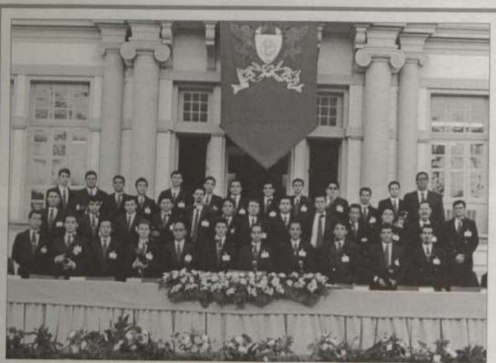
Equipe de fotógrafos da Kello, que registra a Formatura de outubro de 2000

Para os organizadores, FACEV e TV Viçosa, a quarta edição do Festival superou as edições anteriores em vários aspectos, dentre os quais se destacaram o nível dos concorrentes, a identidade visual, o público presente e a transmissão da TV Viçosa.