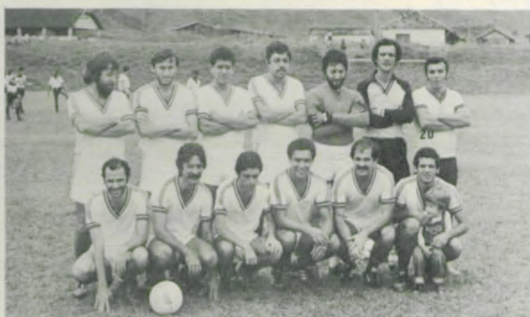
A Seleção de Professores.