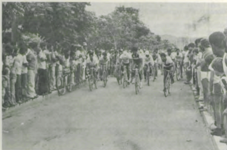
Prova de ciclismo.