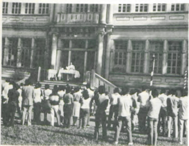
A missa campal.