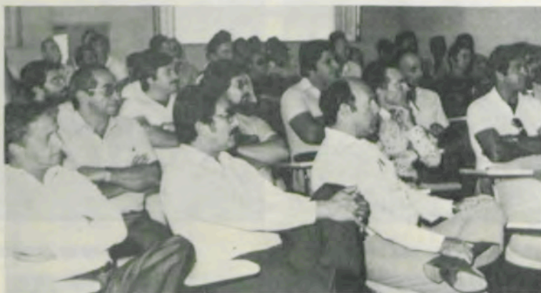
Os suinocultores na reunião promovida pela EMAF.