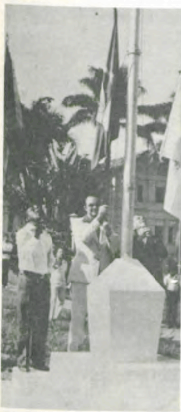
Hasteamento das bandeiras.

Encerrando as solenidades programadas pela UFV, foi realizado às 12h, no Recanto das Cigarras, um churrasco de confraternização.