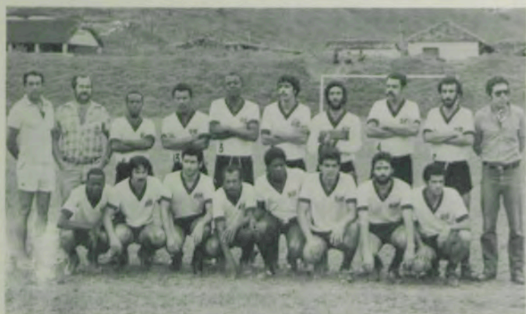
A Seleção de Funcionários.