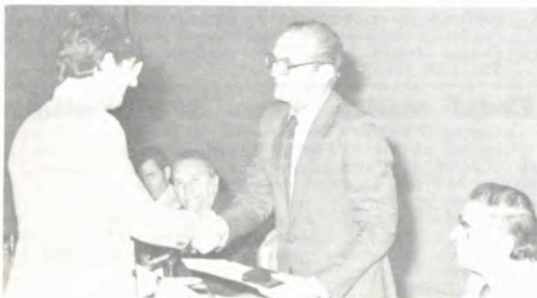
A entrega do prêmio.