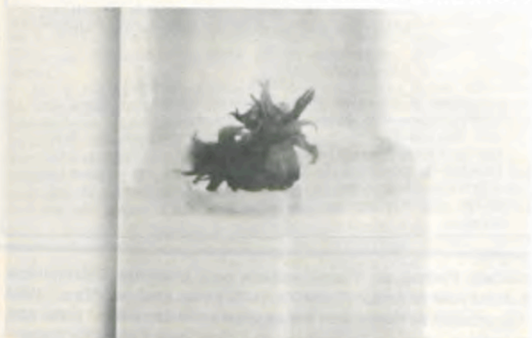
Pequena planta desenvolvida por meio de cultura de tecidos.

ra a instalação de laboratórios destinados à produção de plantas com o uso desse processo, com finalidade comercial e para uso no melhoramento genético, principalmente em plantas frutíferas, florestais e ornamentais. Da Itália, a Companhia Toscano Vincenzo enviou o seguinte telex: "Sicilia é uma região onde se pode cultivar qualquer tipo de árvore, todavia carecemos de tecnologia mais avançada, razão pela qual estamos interessados em sua descoberta. Gostaríamos de receber alguma publicação ou qualquer tipo de informação detalhando a sua técnica, bem como o tipo de colaboração que poderíamos iniciar com sua universidade".