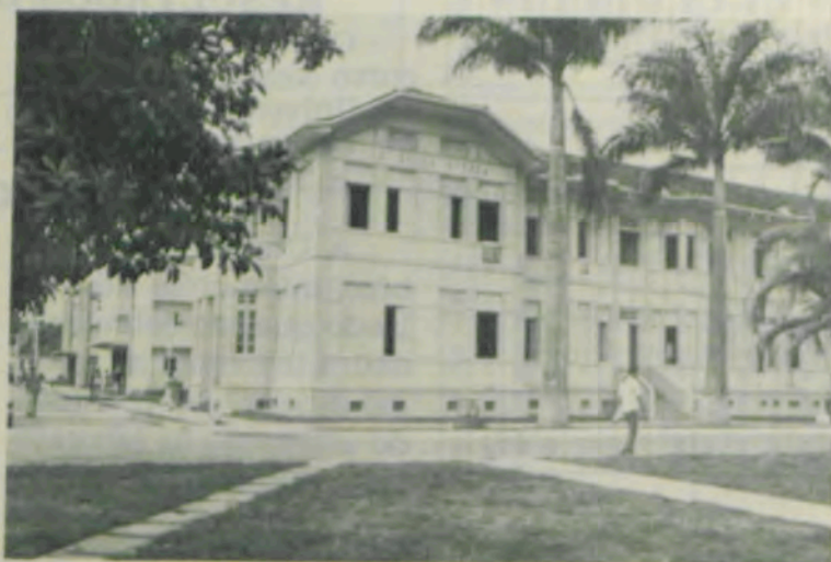
Edifício Belo Lisboa.