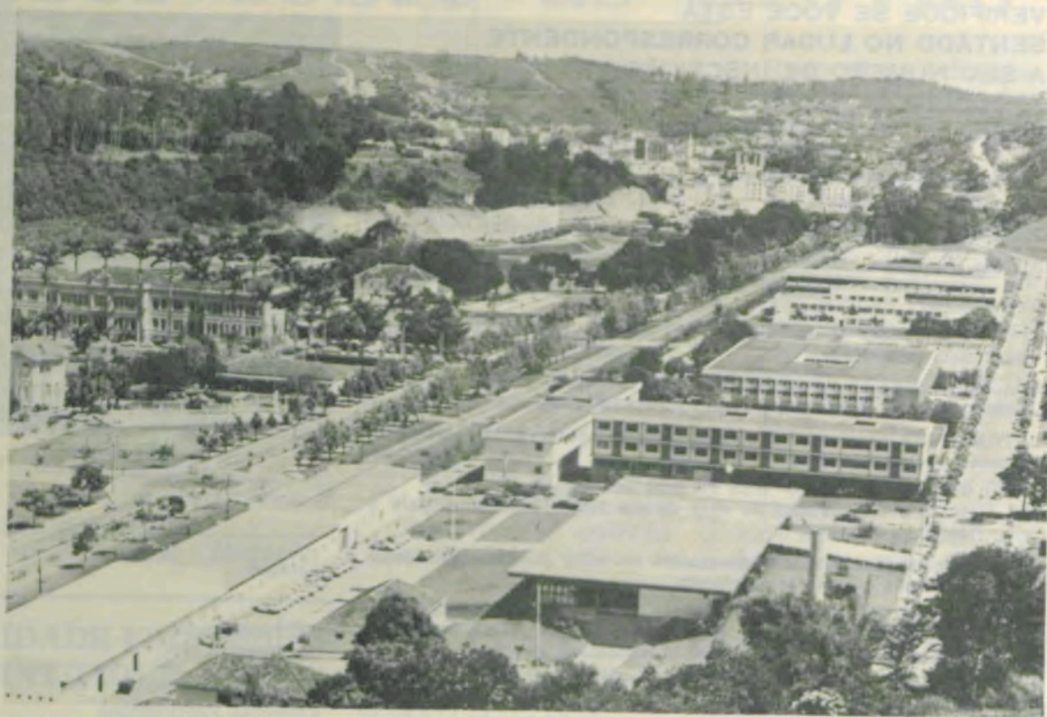
Vista parcial do «campus» universitário.

Tendo em vista os problemas provocados pela crise do petróleo, a Universidade vem pesquisando as fontes alternativas de energia, destacando-se,