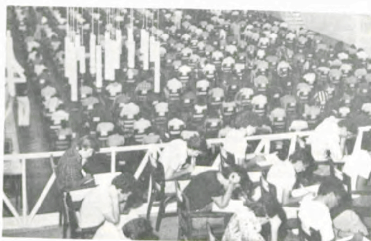
É assim o vestibular no Ginásio de Esportes.